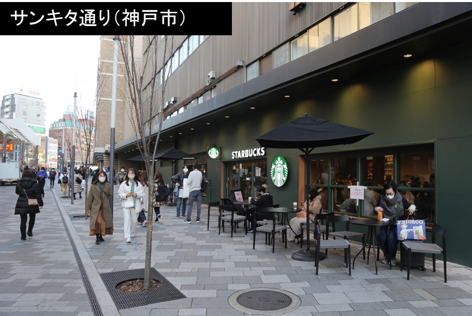
サンキタ通り(神戸市)