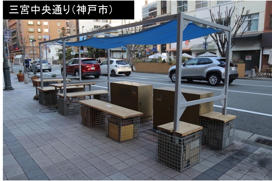
三宮中央通り(神戸市)