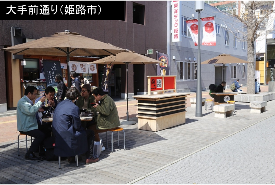
大手前通り(姫路市)